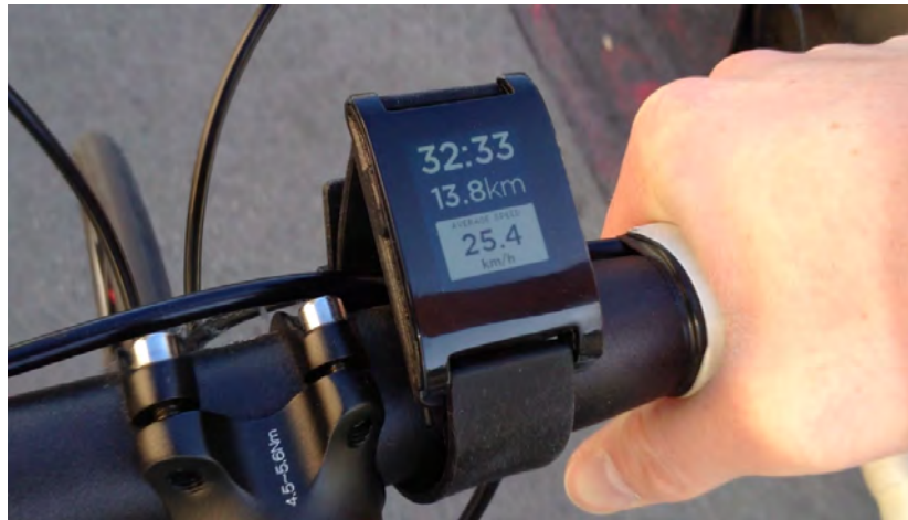
Fig. 4. Pebble Watch siendo utilizado para ciclismo

La campaña de Pebble en llegó a su objetivo de 100000 dolares en un par de horas de su lanzamiento, y cuando la campaña termino un mes después, Pebble habia conseguido mas de 10 millones de dolares, haciendolo la campaña mas exitosa de la historia de Kickstarter. Esta mega-popularidad abrumo al equipo de Pebble; meses seguidos de demoras en la fabricación siguieron al anuncio, y los relojes que la gente esperaba recibir en 2012 eventualmente empezaron a ser enviados en la primavera del 2013.