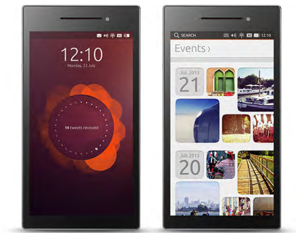
Fig. 1. Ubuntu Edge.

El 22 de Julio de 2013 Canonical lanzo la campaa mas grande de crowdsourcing de la historia en busca de obtener financiación para de desarrollar un producto llamado Ubuntu Edge. La campaa buscaba recaudar la suma de 32 millones de dólares en 30 dias utilizando el sitio de crowdfunding Indiegogo. La fabricación inicial estaría limitada a 40000 dispositivos.