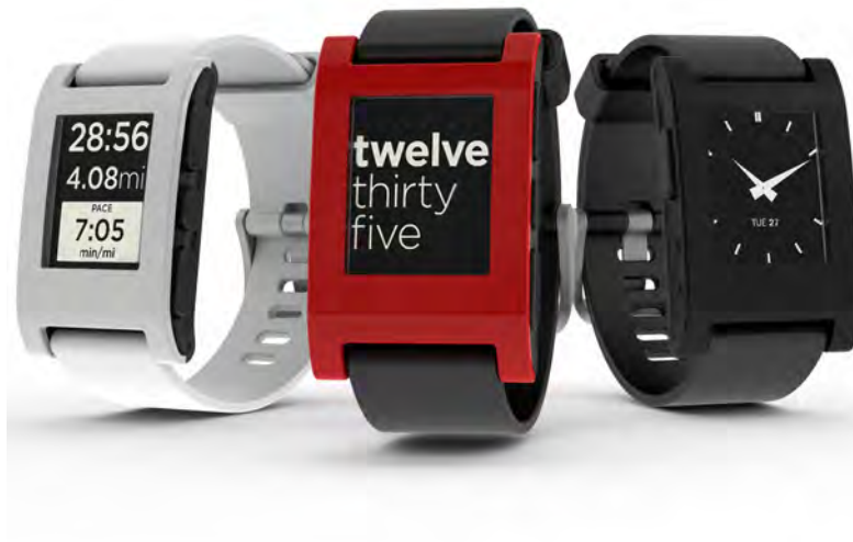
Fig. 3. Pebble Watch

En Abril de 2012, un equipo de ingenieros publicó en Kickstarter un proyecto para financiar Pebble, un reloj de pulsera inteligente que se conectaría al smartphone y alertaría al usuario de llamadas, emails, mensajes de texto y otras notificaciones. Con una pantalla de tinta electrónica el Pebble podría ser leído en plena luz del día. También permitiría a developers integrar sus aplicaciones con el Pebble.