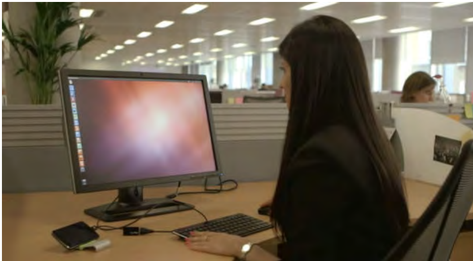
Fig. 2. Ubuntu Edge siendo usado como estación de trabajo.

un teléfono móvil cuando el usuario esta en movimiento y como una estación de trabajo Ubuntu cuando el usuario este conectado a un monitor externo. Para poder cumplir ambos roles de forma eficiente el Ubuntu Edge prometia componentes de última tecnología, abundante memoria y una duradera batería.